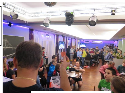
Večerní losování tomboly